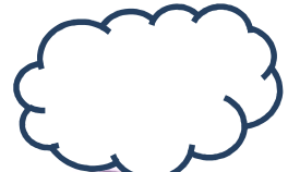
~110 年 07 月份~