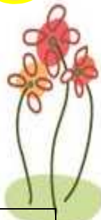
~110 年 05 月份 ~